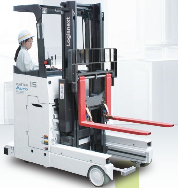
Photo : FBR15-AG80-250 2,500mm マスト装着車