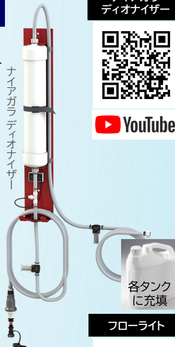
ナイアガラ ディオナイザー